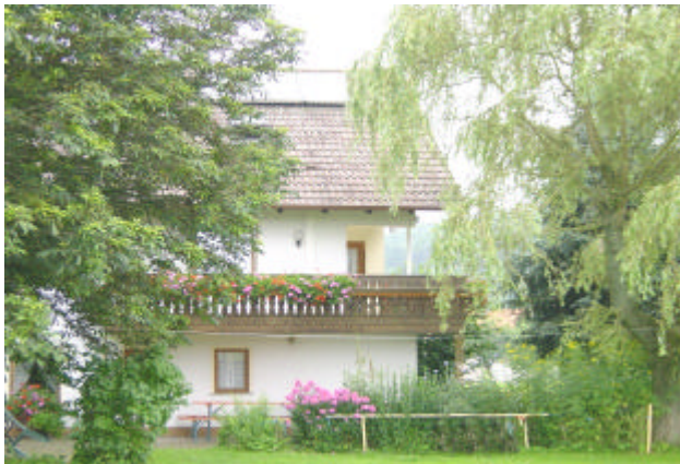
Blick vom Spielplatz auf das DZ mit Balkon

Bettwäsche und Handtücher werden gestellt.